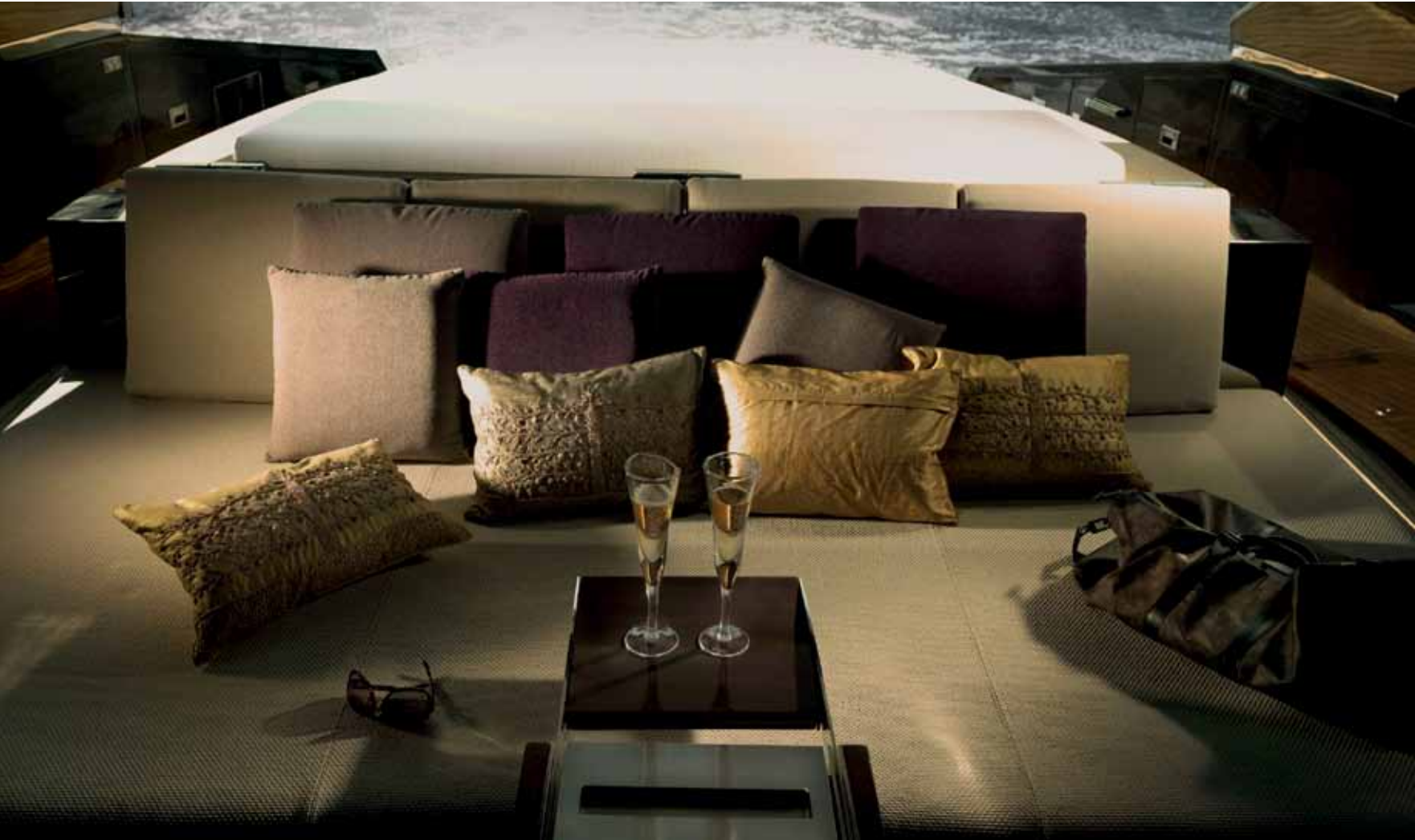
Veliko sjedište u kokpitu presvučeno posebnom tkaninom ima nesputan pogled na okolinu, te je idealno mjesto za provođenje vremena na otvorenom

platforma, koja je idealna za morske aktivnosti, a u sebi krije spremišta za bokobrane i mostić sa stubama koji služi za ulazak u brod, ali i za silazak u more. U bočnim stijenkama kokpita mnogobrojna su spremišta, izvedena kao ladice ili pretinci te dva hladnjaka, a tu su skrivene i stube za izlazak na pramac. Cijeli prostor izuzetno je skladno dizajniran s mnogo osjećaja za detalje. Primjerice, vitlima za pritezanje krmene užadi upravlja se pomoću vješto skrivene papučice, izrađene od nehrđajućeg čelika i tikovine; nisam siguran je li taj detalj ljepši ili praktičniji. Na prvi pogled ćete se iznenaditi kada uz donji rub kokpita ugledate more, koje se vidi kroz bočne prozore, a i drugih detalja koji će vam privući pozornost zaista ima u izobilju, poput hvatišta Sea Smart za bokobrane. Pristup pramcu jednostavan je i siguran, što smo isprobali i na valovitu moru, a taj dio broda krije neočekivanu oazu za uživanje u privatnosti: naime paluba je izvedena konkavno i prekrivena tikovinom, što joj neprimjetno daje udobnost za boravak na tom, prema našem mišljenju itekako atraktivnom brodskom prostoru. Na vrhu pramca nalazi se radni prostor u kojem je smještena konzola sa sidrom, koja se - kao na jedrilicama - hidraulički izvlači vani, te nadvisuje oštar pramac. Cijeli eksterijer plovila osmišljen je kao skladna i jednostavna cjelina za uživanje. Iako vanjština obiluje nesvakidašnjim i estetski izuzetno doradenim detaljima, interijer ipak